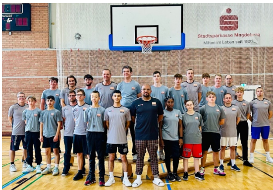
Schiedsrichterfortbildung in Magdeburg