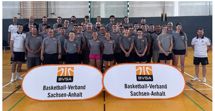
Schiedsrichterfortbildung in Halle