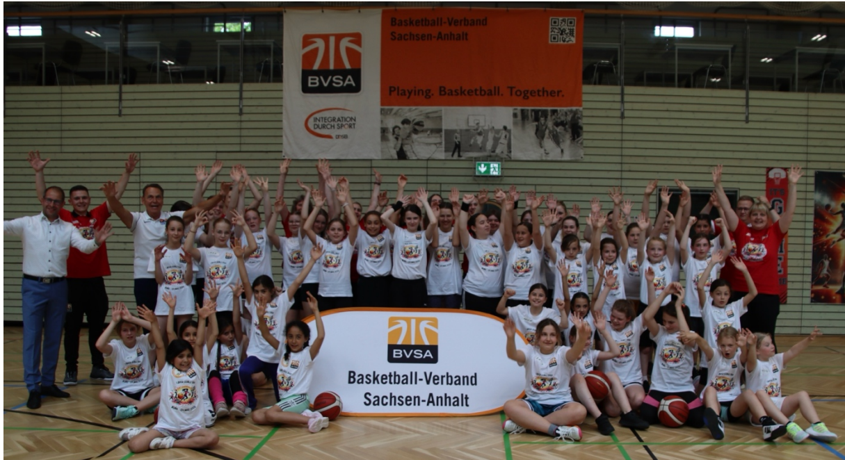
Erster BVSA Girls‘ Day in Burg

Besondere Bedeutung hatte dabei der regelmäßige Austausch zwischen haupt- und ehrenamtlich Mitarbeitenden. Ziel war es, gemeinsame Standards zu schaffen, Prozesse effizienter zu gestalten und die strategischen Ziele des Verbandes nachhaltig umzusetzen.