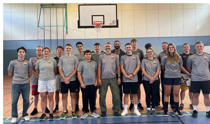
Schiedsrichterfortbildung in Salzwedel