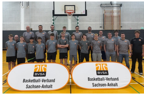
Schiedsrichterfortbildung in Halle