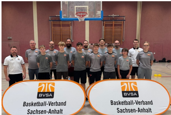
Schiedsrichterfortbildung in Aschersleben

Anfang der Saison 2025/26 bot der BVSA 5 SR-Fortbildungen an. Alle Fortbildungen wurden durchgeführt. Die Fortbildungen wurden stark besucht und es fand ein reger Austausch von Wissen, Wünschen und Meinungen statt. Im Zuge der saisonalen Fortbildungen fand ebenfalls I Oberligakader-Lehrgang und I Förderkader-Lehrgang in Halle für die jeweiligen Kadermitglieder statt.